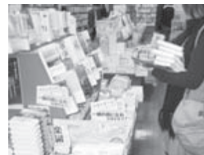
熱心に図書を選ぶ学生モニター

また、浜松分館では、「この本、あったらいいな」学生による学生のための選書キャンペーンを平成19年10月に開催しました。学習や研究に必要な38冊の図書が購入されました。こちらも合わせてご利用ください。