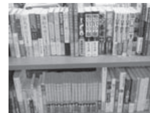
学生モニターによって選ばれた資料